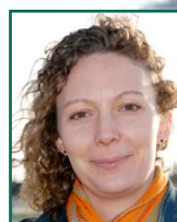
4 - Sophie ARNOULD